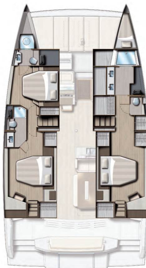
3 cabins and 3 baths version + starboard forepeak fitted out (option) Version 3 cabines / 3 sdb + pointe avant tribord aménagée (option)