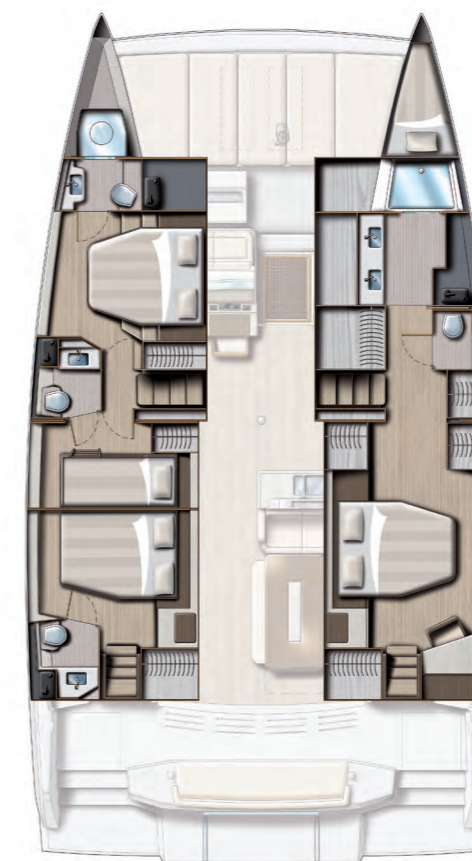
4 cabins and 4 baths (Owner's) version + starboard forepeak fitted out (option) Version 4 cabines / 4 sdb (propriétaire) + pointe avant tribord aménagée (option)