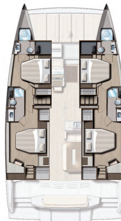
4 cabins and 4 baths version (symmetric) Version 4 cabines / 4 sdb (symétriques)