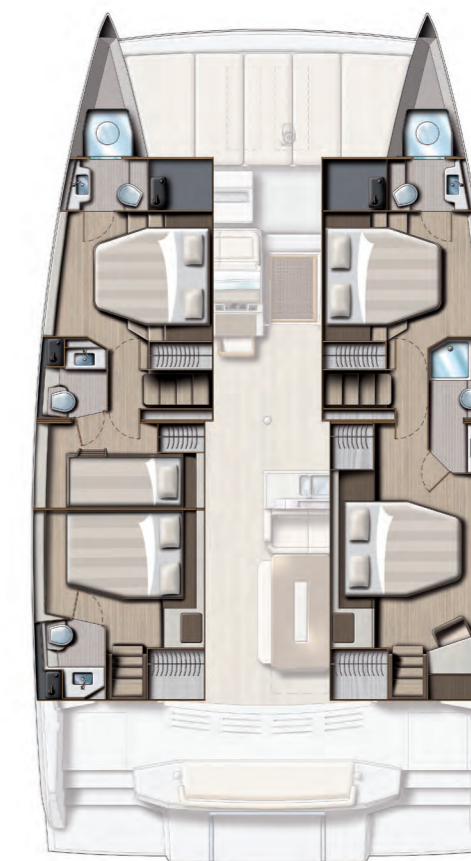
5 cabins and 5 baths version Version 5 cabines / 5 sdb