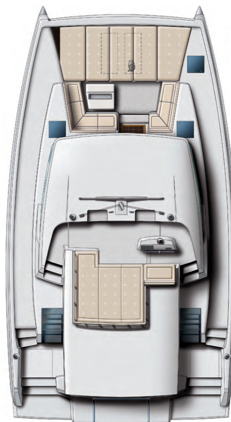
Deck and flybridge Pont et flybridge