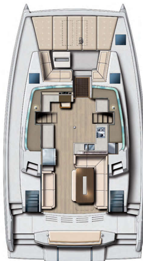
Nacelle and cockpits Nacelle et cockpits