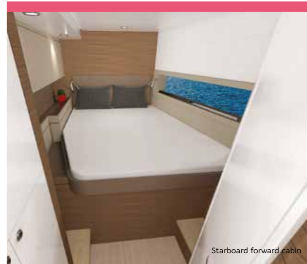
Starboard forward cabin