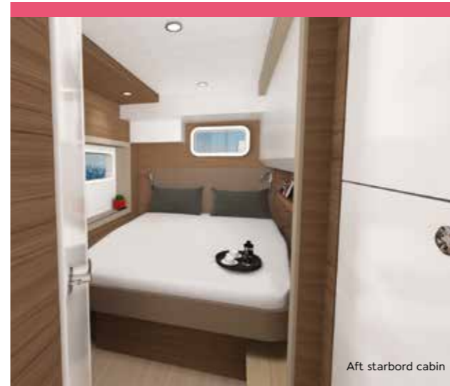
Aft starbord cabin