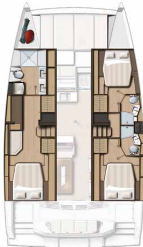
3-cabin / 3-bath «Owner's» version Version «Propriétaire» 3 cabines / 3 sdb