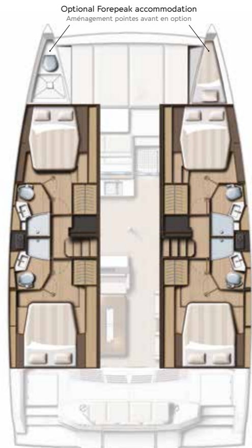
4-cabin / 4-bath symmetrical version Version 4 cabines / 4 sdb symétriques

Les cabines où la modernité et le raffinement vont de pair, sont pensées pour le plus grand confort. Chaque cabine dispose d'une belle salle d'eau avec toilettes et douche. La suite propriétaire occupe toute la coque bâbord pour créer un espace tout en intimité.