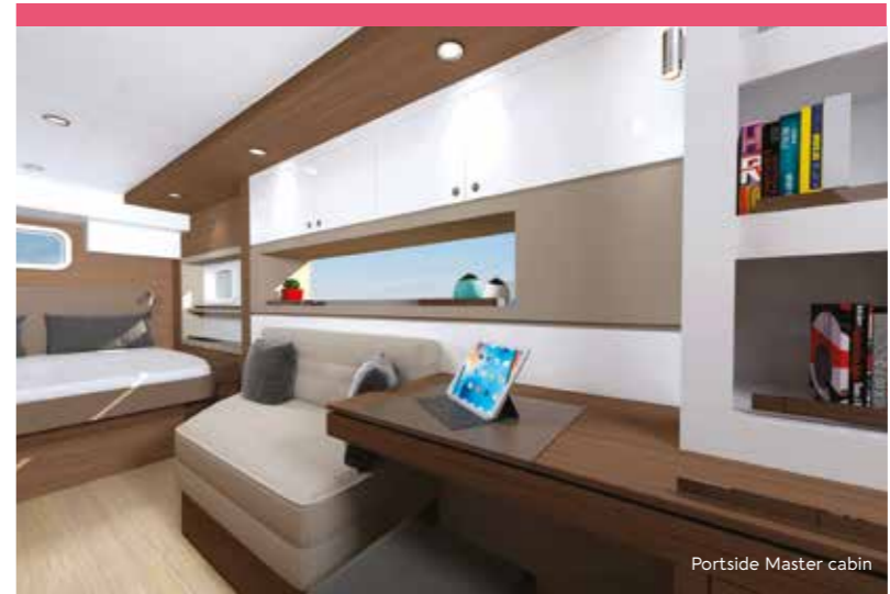
Portside Master cabin