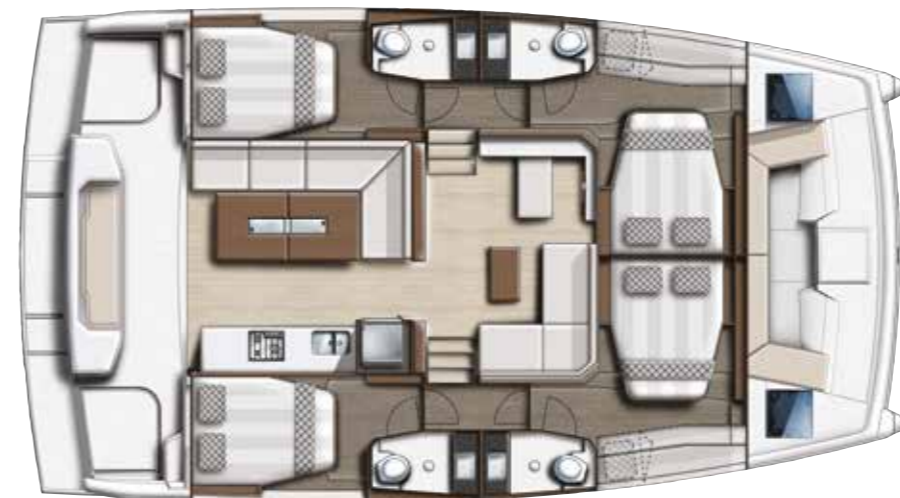
4 cabins family version / Version 4 cabines family