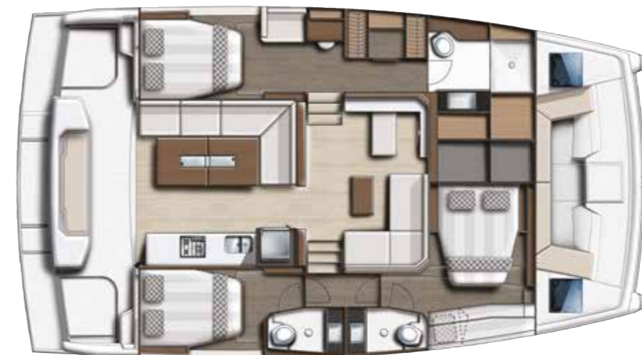
3 cabins Owner's version / Version 3 cabines propriétaire

Draft / Tirant d'eau Fresh water capacity / Eau douce Fuel capacity / Carburant Refrigerator + freezer / Réfrigérateur + congélateur Engines power / Motorisation CE CAT : 2'11" / 0.89 m up to / jusqu'à 700 L / 154 US Gal up to / jusqu'à 1400 L / 308 US Gal 272 L / 9.6 cu ft Yanmar 2 x150 up to 2 x 250 HP / CV Pending / En cours